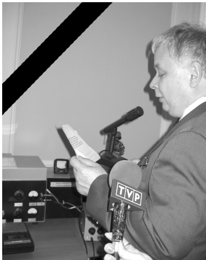
Pan Prezydent Warszawy Lech Kaczyński podczas nadawania przez replikę radiostacji „Błyskawica”