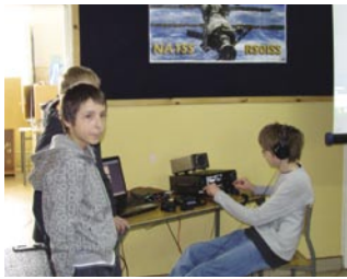
Młodzi operatorzy stacji klubowej SP5PMD

ści ze stacją ISS trwała dość krótko, bo około 10 minut to stacja klubowa SP5PMD nawiązała jako pierwsza łączność ze stacją SN0ISS, którą przeprowadziłem osobiście a którą z zainteresowaniem wysłuchali wszyscy obecni. - Mam nadzieję, że z tej grupy na pewno wielu uczniów zainteresuje krótkofalarstwo.