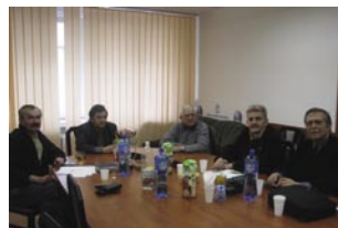
Posiedzenie komisji łączności

Brakuje jeszcze zgłoszeń od Stowarzyszeń z Rosji, Bułgarii, Rumuni i Ukrainy. Termin Mistrzostw HST-2010 został wynegocjowany przez Rosjan na spotkaniu HST WG w Obzor